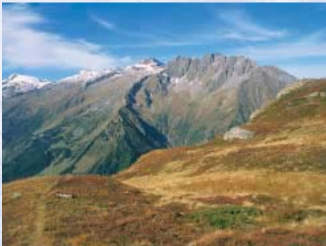
Blick auf Grinbergspitzen (rechts) u. Hoher Riffler (links) Unterhalb des Kammes verläuft der Berliner Höhenweg

Die Gamshütte ist der nördlichste Stützpunkt im Tuxer Hauptkamm, der mit Schrammacher, Fußstein, Olperer und Hoher Riffler namhafte Gipfel aufweist. Die Hütte steht am nordöstlichen Auslauf des Kammes und befindet sich in freier Lage südwestlich von Finkenbergr an den Hängen des Gamsberges. Ungehindert ist der Blick in den Floitengrund mit Floitenkees, Dristner und Großer Löffler (siehe Hüttenbild), zur Ahornspitze, zum Rastkogel und Penken sowie ins Tal nach Ginzling und Mayrhofen.