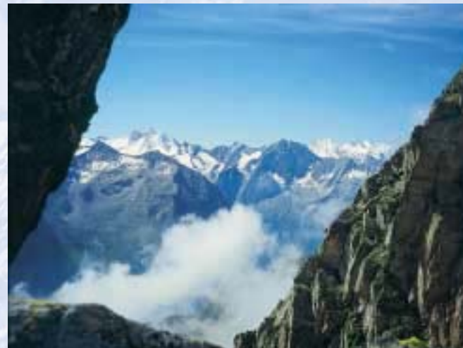
Unterwegs zur Vorderen Grinbergspitze. Im Hintergrund rechts Hochfeiler, links Großer Möseler.

Knapp einen Kilometer vorm Talort Ginzling, beginnend am Gasthof Gamsgrube, auf dem Georg-Herholz-Weg mit Weg Nr.533a in knapp 3 Std. (970 Hm) zur Hütte.