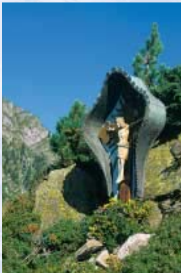
Wegkreuz unterhalb der Gamshütte