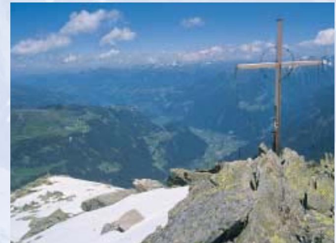
Blick von Vorderer Grinbergspitze auf Penken und Mayrhofen

Eine reizvolle Höhenwanderung ist von der Gamshütte aus der Rudolf-Stöckl-Weg in ca. 2 Std. zur Elsalpe. Von dort weiter in knapp 2 Std. zur Höllensteinhütte. Abstiege nach Lanersbach und Hintertux.